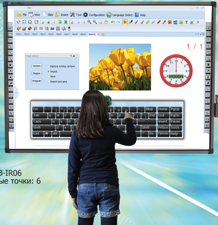
IWB-IR06 Сенсорные точки: 6

что делает компьютер и проектор мощными инструментами для обучения и интерактивных уроков